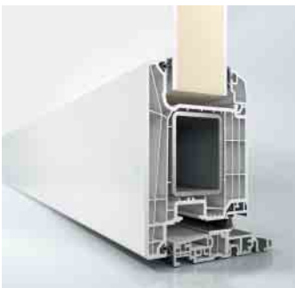
Schüco LivIng Haustür, nach außen öffnend

Erhöhte Anforderungen an die Sicherheit können mit dieser Türschwelle – genau wie bei Fenstern gelöst werden. So ist Einbruchhemmung bis Widerstandsklasse 2 (RC2) möglich.