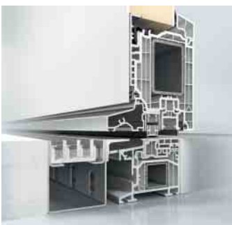
Schüco LivIng Haustür, nach innen öffnend

Mit der innovativen 0 mm-Türschwelle von Schüco gehören selbst kleinste Stolperfallen der Vergangenheit an. Die bodenebene Schwelle bietet maximale Barrierefreiheit für Ihre nach innen öffnenden Haus- und Nebeneingangstüren aus dem Schüco LivIng System. Da kein Trittschutzprofil zur Schmutzbeseitigung entnommen werden muss, ist eine besonders leichte Reinigung möglich.