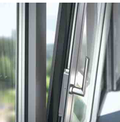
Hybrid-Riegelstange in bewährtem Alu-Design Hybrid locking bar in tried-and-tested aluminium design