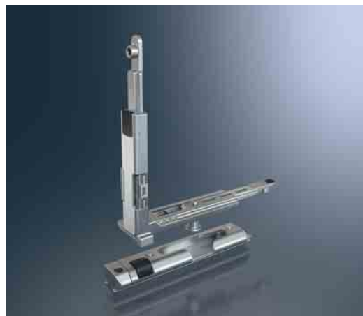
Eckumlenkung mit integrierter Schließrolle und Auflaufbock Corner drive with integrated locking roller and engagement block