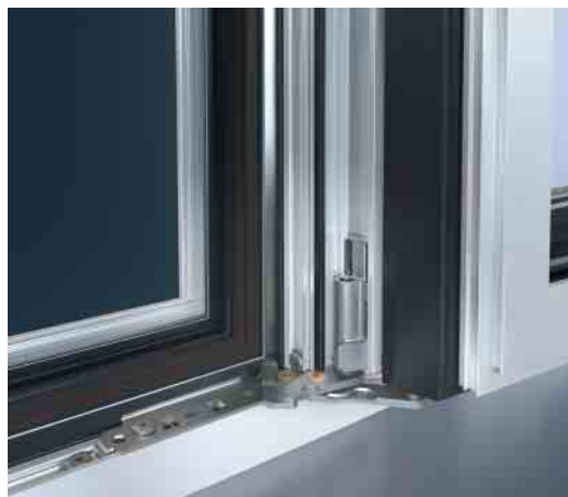
Ecklager mit 180°-Öffnungswinkel Corner pivot with 180° opening angle