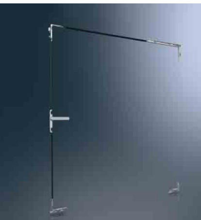
Beschlagskonfiguration Dreh-Kipp-Fenster Fittings configuration for turn/tilt windows