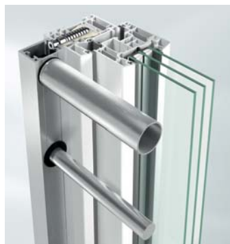
Mocowanie za pomocą kotwy chemicznej

Balustrada ażurowa Średnica prętów od 12 do 35 mm