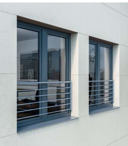
Indywidualny akcent fasady – balustrady z wypełnieniem ażurowym

Balustrady szklane i ażurowe mogą być łączone ze znanymi i cenionymi na rynku oknami Schüco z PVC-U: Schüco LivIng, Schüco AluInside, Schüco Corona SI 82 oraz Schüco Corona CT 70. Elastyczne rozwiązanie portfenetrów pozwala także na stosowanie rolet i systemowych nakładek aluminiowych na okna.