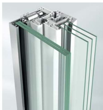
Mocowanie za pomocą dybla profilowego