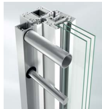
Mocowanie za pomocą listwy przylgowej