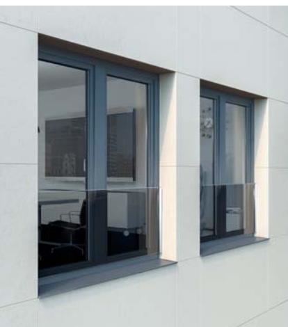
Doskonały widok na zewnątrz – balustrady z wypełnieniem szklanym

Jasne, dobrze doświetlone pomieszczenia to obowiązujący trend we współczesnej architekturze. Dlatego tak modne są obecnie sięgające od podłogi do sufitu okna, które wpuszczają światło dzienne w głąb pomieszczenia. Ze względu na wymogi bezpieczeństwa muszą być one zabezpieczone balustradami spełniającymi odpowiednie normy i wymagania techniczne, jednak do tej pory ich montaż wymagał ingerencji w fasadę budynku. Opracowane z myślą o systemach okiennych Schüco z PVC-U nowe balustrady są montowane bezpośrednio do ościeżnicy, co znacząco ułatwia produkcję portfenetrów i zapewnia estetyczny wygląd elewacji. Innowacyjne rozwiązanie zostało przebadane wraz z oknami Schüco z PVC-U jako kompletna konstrukcja, dzięki czemu gwarantuje maksymalne bezpieczeństwo użytkowania i skraca czas montażu.