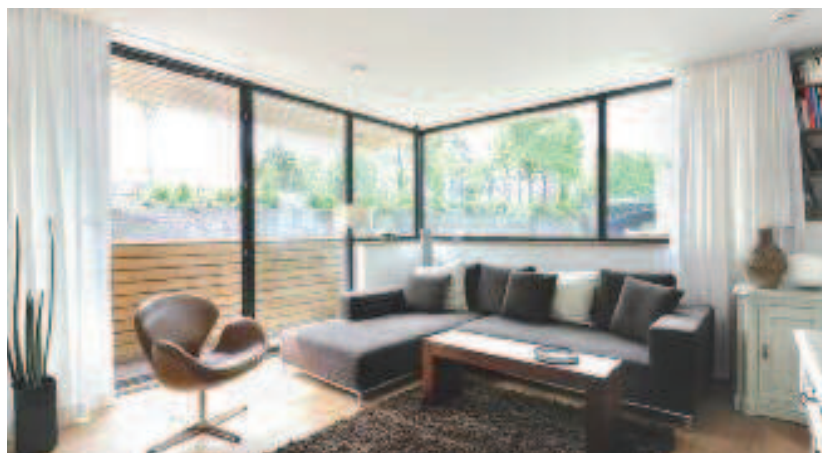
Schüco Fenêtre AWS 60 Schüco Window AWS 60