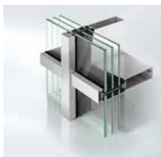
Schüco Gevel FWS 35 PD.SI Façade Schüco FWS 35 PD.SI

Système de mur-rideau en aluminium - Panorama Design