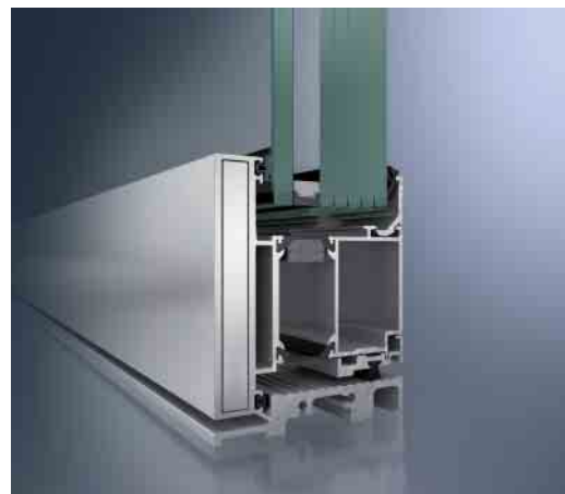
Schüco ADS 90 BR als FB4-Lösung Schüco ADS 90 BR as FB4 solution

Mit dem Schüco Türsystem ADS 90 BR lassen sich einbruch- und durchschusshemmende Anforderungen bis zur Klasse RC4 bzw. FB4 für 1- und 2-flügelige Türen systemtechnisch realisieren. Dabei können wie beim Fenster-system die einbruch- und durchschusshemmenden Eigenschaften bis RC4 mit FB4 problemlos kombiniert werden. Ein weiteres Plus ist, dass diese Anforderungen sowohl mit nach außen wie auch mit nach innen öffnenden Türen erfüllt werden können. Auch hier gilt die Schüco Maxime: Erhöhter Schutz muss nicht sichtbar sein.