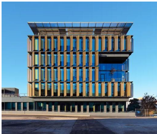
HQ Gruppo Zucchetti

Il progetto si basa sul dialogo tra conservazione e nuova costruzione, combinando sottrazioni e aggiunte volumetriche e riorganizzando gli spazi interni per riqualificare un complesso preesistente