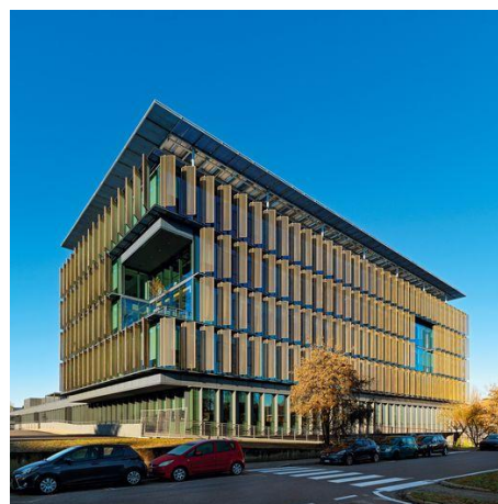
HQ Gruppo Zucchetti