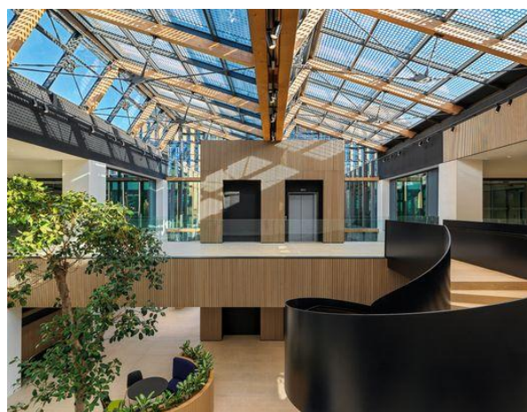
HQ Gruppo Zucchetti