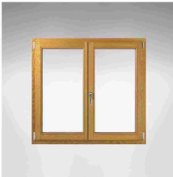
FINNOVA, F68 PLUS Finestra con telaio a triplice battuta di frassino lamellare, dotata di tre guarnizioni di cui una acustica sul lato interno per un'insonorizzazione totale. Ferramenta zincata anticorrosione e antieffrazione. ● Window with a triple-rebate laminated ash frame, fitted with three seals, including an internal acoustic seal for complete sound insulation. Rustproof, burglar-proof zinc-plated ironmongery. finnovasrl.it

Ritaglio stampa ad uso esclusivo del destinatario, non riproducibile.