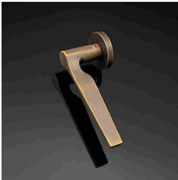
VALLI&VALLI, H 1062 CARMEN Maniglia di ottone dalla forma semplice e minimale. L'avanzata ergonomia garantisce una presa comoda. ● Brass handle with a simple, minimalist form. Advanced ergonomics ensure a comfortable grip. vallihandles.com/it-home