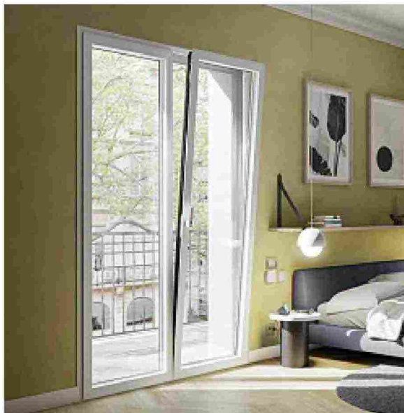
SCHÜCO ITALIA, BLOCK SYSTEM Finestra di alluminio con profili dell'anta sottili e privi di fermavetro interno, invisibili dall'esterno per favorire l'ingresso di luce naturale. Apertura e chiusura automatizzate grazie al sistema TipTronic e con un tocco sulla maniglia o da remoto tramite device. ● Aluminium window whose frames - slimline and with no inner glazing beads - are hidden from the outside to increase the amount of daylight coming in. Automated opening and closing via the TipTronic system, operated by a touch on the handle or remotely from a device. schueco.it