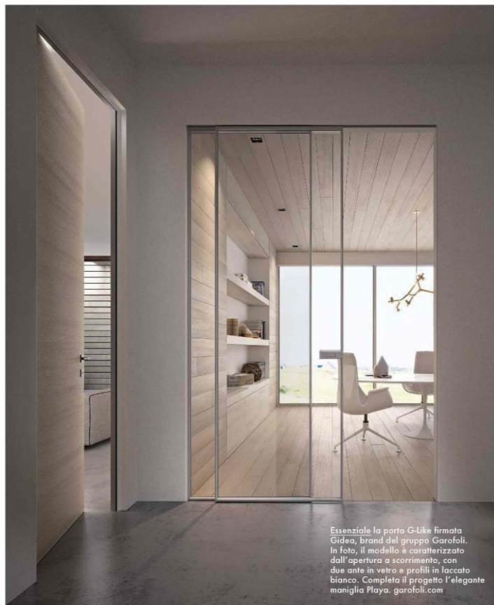
Essenziale la porta G-Like firmata Gidea, brand del gruppo Garofoli. In foto, il modello è caratterizzato dall'apertura a scorrimento, con due ante in vetro e profili in laccato bianco. Completa il progetto l'elegante maniglia Playa. garofoli.com

di Tamara Bianchini - testi Murielle Bortolotto