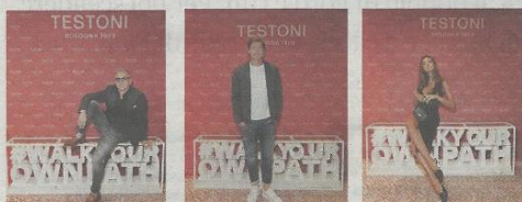
Da sinistra: Bruno Barbieri, Aldo Montano e Maddalena Ghenea

Con una partecipata serata-evento, il brand riapre nel QUADRILATERO DELLA MODA MILANESE