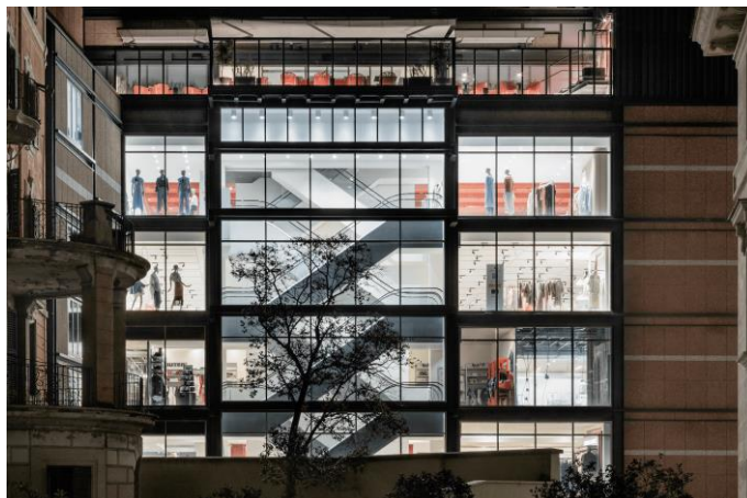
Restyling della facciata della Rinascente di piazza Fiume a Roma. www.rinascente.it

Nel dettaglio, sono state ingegnerizzate da Thema alcune soluzioni di facciata, montanti e traversi in alluminio Schüco “su misura”, che hanno risposto perfettamente alle esigenze estetiche, prestazionali e di sicurezza dell’involucro , grazie alla versatilità e alla resistenza che caratterizzano l’alluminio, dando solidità alla struttura e preservandone la trasparenza complessiva.