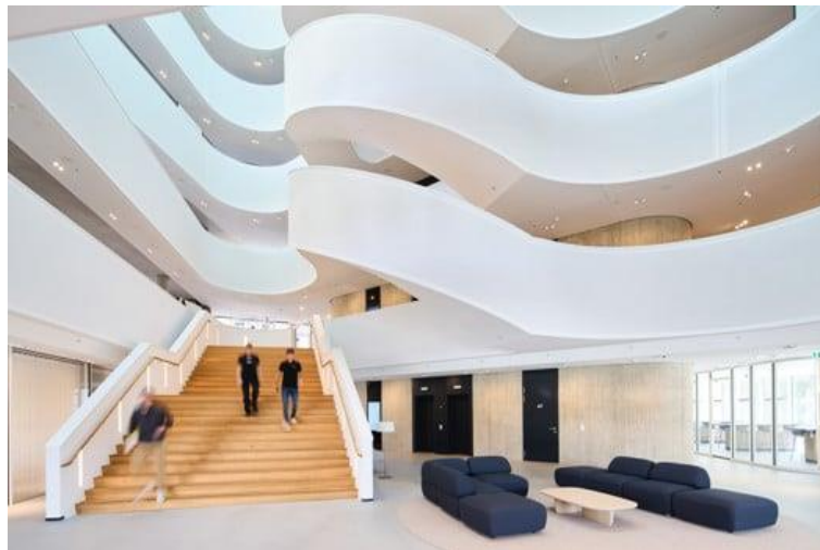
Fluidità delle forme e osmosi tra gli ambienti si riflettono nella struttura architettonica dell'edificio