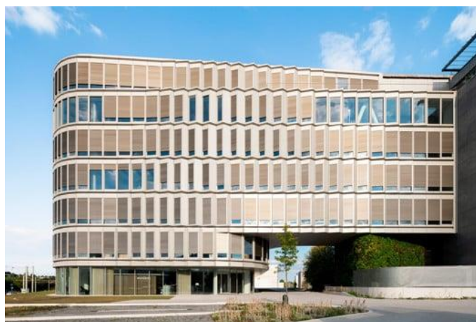
HQ Schüco a Bielefeld, Germania

Per il tetto in vetro sopra l'atrio centrale è stata utilizzata una soluzione Schüco AOC con un sistema di lucernari motorizzati. La schermatura solare è assicurata dal vetro elettrocromico SageGlass che si scurisce per regolare l'immagazzinamento di calore.