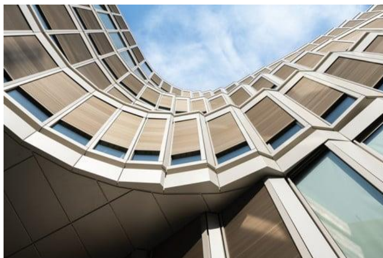
Schüco One sarà uno dei primi edifici al mondo a ricevere le tre certificazioni di sostenibilità LEED, BREEAM e DGNB