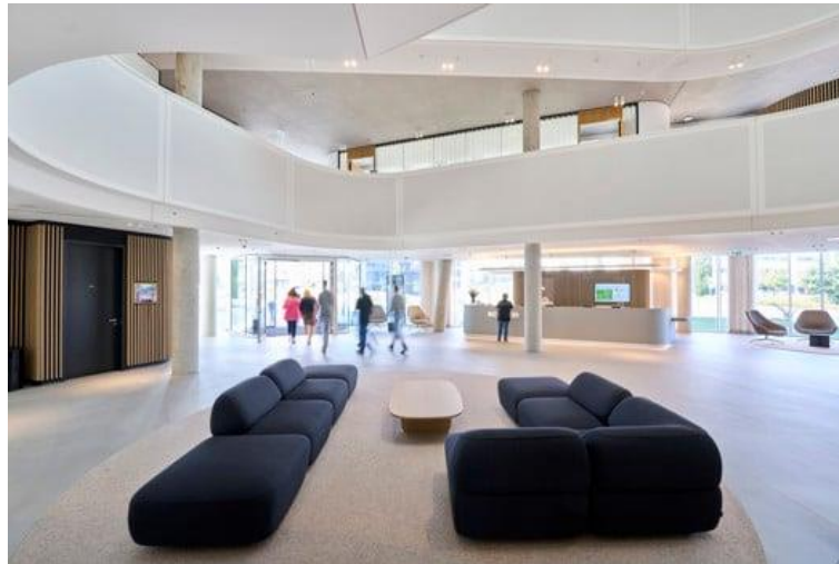
Il nuovo quartier generale Schüco One, frutto di investimenti da parte di Schüco