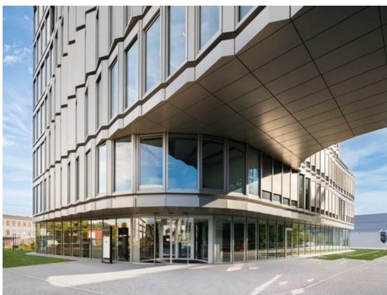
Schüco One: innovativo e caratteristico edificio che vede i sistemi in alluminio Schüco utilizzati per finestre a nastro, lucernari e facciate

Lo studio danese 3XN progetta Schüco One: nastri di finestre, lucernari e superfici vetrate per un edificio sostenibile e all'avanguardia