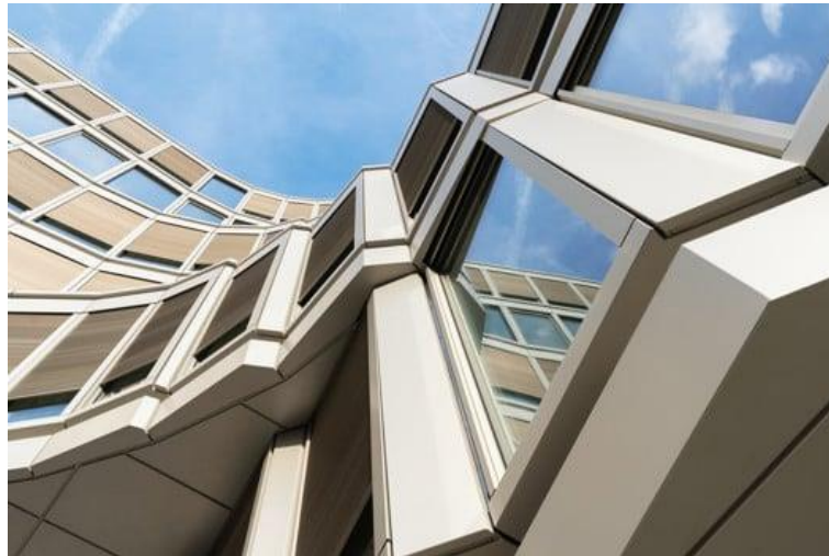
Gli affacci dei sei piani sono costituiti da nastri di finestre customizzati, con il sistema in alluminio Schüco AWS 75.SI+