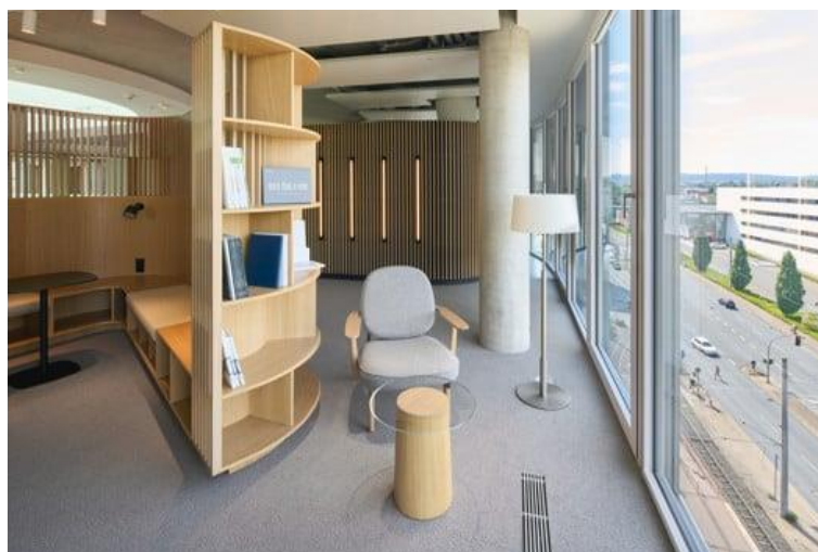
In Schüco One ambienti di lavoro aperti incoraggiano la comunicazione informale e invitano a collaborare.