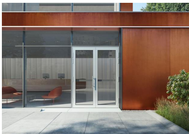
Schüco Italia | Ads 65 Hd Gen2.

Il nuovo sistema Schüco Ads 65 Hd Gen2, dove Hd sta per Heavy Duty e 65 indica la profondità costruttiva di 65 mm, rappresenta la nuova generazione dei sistemi per porte in alluminio Schüco.