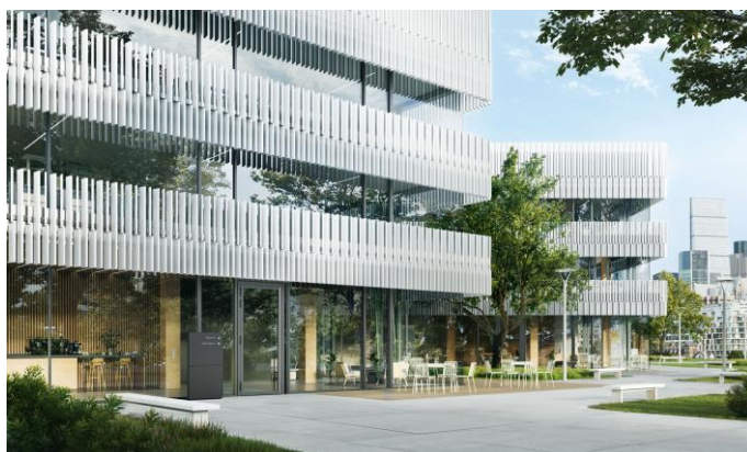
SchüCo | Sistema Ads 65 Hd Gen2, soglia a filo pavimento.

Grazie al nuovo sistema di guarnizioni centrali , Schüco Ads 65 Hd Gen2 soddisfa pienamente le esigenze in termini di resistenza agli agenti atmosferici.