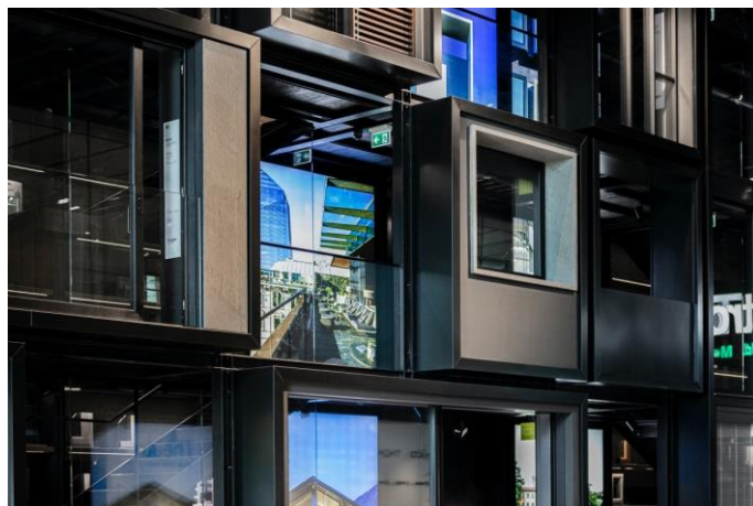
Theatro, product scenography.

La sede di Theatro a Verano Brianza è un viaggio esperienziale tra le competenze: generosi spazi per poter raccontare le soluzioni per l'architettura, passando dalle facciate alle partizioni interne , dalle innumerevoli scelte legate alla climatizzazione alle opzioni estetiche a disposizione della progettazione.