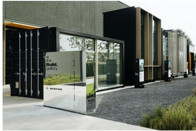
Theatro: the Build gallery

Le aziende che fanno parte del network sono Schüco Italia, Thema, AGC, ASSA ABLOY Entrance Systems, Duravit, Resstende, Schneider Electric, Culligan, Daikin, Daku, Florim, Griesser, iGuzzini, Kairos, Laboratorio Morsetto, Legnotech, Pellinindustrie, Pratic, Roda, Starpool, Technogym, Banco Desio, Pro Viaggi Architettura.