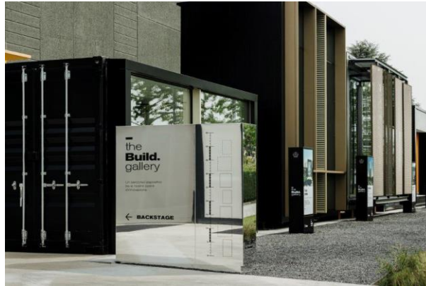
Theatro_the Build gallery

Nel suo primo triennio di attività Theatro ha riunito oltre 20 aziende provenienti da diversi settori e ha preso parte a 176 progetti . Questo, insieme all'organizzazione di circa 25 eventi culturali di rilievo, ha permesso ai partner di entrare in contatto con 2.780 architetti e progettisti . Il fatturato complessivo delle aziende partner maturato grazie al network è oltre 43 milioni di euro .