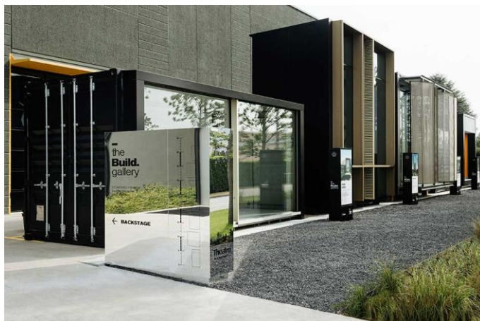
Il nuovo percorso esterno di mock-up The Build Gallery.