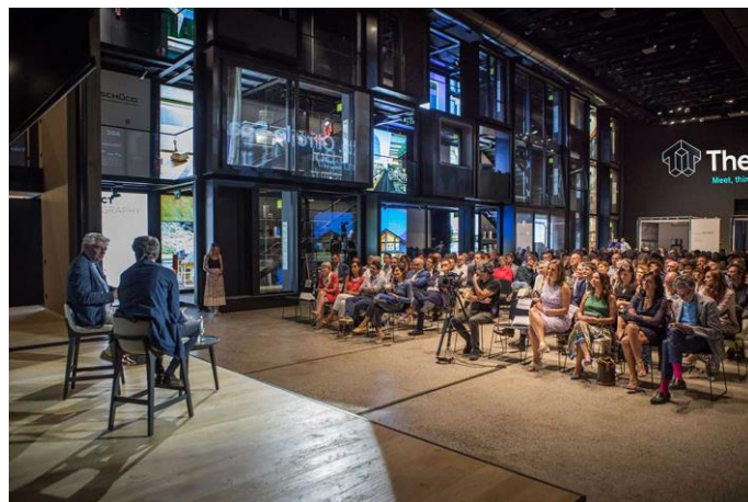
Un momento della lectio "Mario Botta. Oltre lo Spazio", 10 luglio 2019.

Theatro non ha scopi di lucro, non vende prodotti o progetti, è un'entità neutrale e mediatrice attraverso cui i progettisti possono condividere con le aziende che fanno parte del network – Schüco Italia, Thema, Agc, Assa Abloy Entrance Systems, Duravit, Resstende, Schneider Electric, Culligan, Daikin, Daku, Florim, Griesser, iGuzzini, Kairos, Laboratorio Morsetto, Legnotech, Pellinindustrie, Pratic, Roda, Starpool, Technogym, Banco Desio, Pro Viaggi Architettura – know-how, conoscenze e soluzioni integrate per rispondere alle evoluzioni tecnologiche, di performance e normative nel settore edilizio.