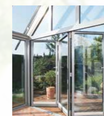
Wintergärten und Balkone