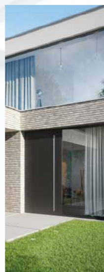
Türsysteme und Beschläge