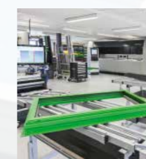
Maschinen und Software

Produkte, Tools und Services von Schüco unterstützen die gesamte Bandbreite der Gestaltung moderner Gebäudehüllen. Wir ermöglichen die Umsetzung komplexer technischer Anforderungen aus einem Guss. Systembasiert oder als individuelle Sonderkonstruktion.