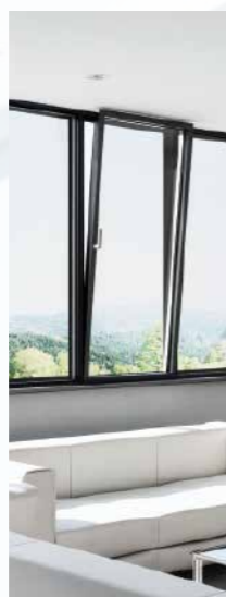
Fenstersysteme und Beschläge