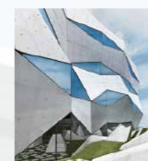
Individuelle Objekt- Sonderkonstruktionen