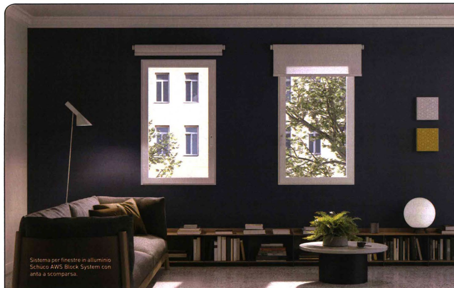
Sistema per finestre in alluminio Schüco AWS Block System con anta a scomparsa.