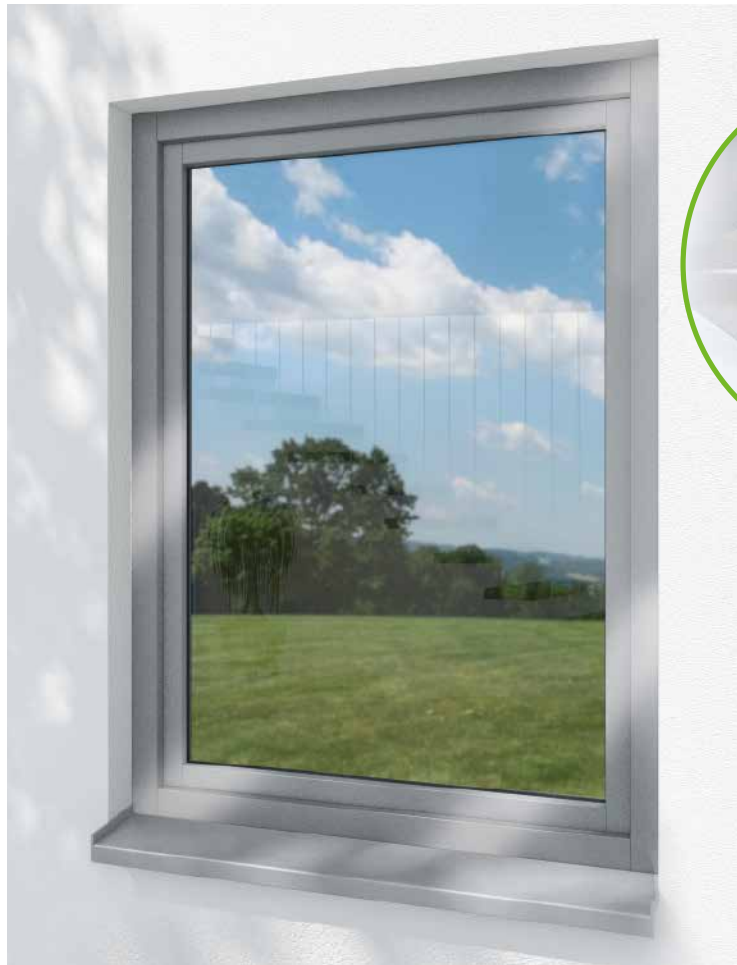
Schüco TopAlu Classic für alle Systeme