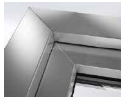
Ausführung mit Gehrungsecken

Selbst im Detail bieten Ihnen die Aluminium-Deckschalen der Schüco TopAlu Serie noch individuellen Gestaltungsspielraum. So können Sie bei der Ausführung der Element-Ecken zwischen zwei Varianten wählen: die Aluminium-Deckschalen können klassisch auf Gehrung, oder um eine perfekte Aluminium-Fensteroptik zu erzielen, stumpf gestoßen werden.