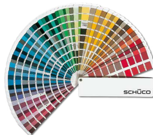
RAL- und Eloxal-Farben

Selbst im Detail bieten Ihnen die Aluminium-Deckschalen der Schüco TopAlu Serie noch individuellen Gestaltungsspielraum. So können Sie bei der Ausführung der Element-Ecken zwischen zwei Varianten wählen: die Aluminium-Deckschalen können klassisch auf Gehrung, oder um eine perfekte Aluminium-Fensteroptik zu erzielen, stumpf gestoßen werden.