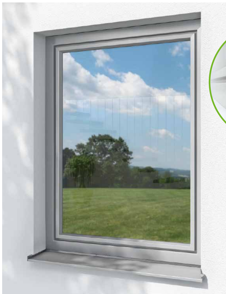
Schüco TopAlu Pure für Schüco Living