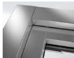
Ausführung mit stumpf gestoßenen Ecken

Schüco TopAlu ist mit nahezu allen Schüco Kunststoff-Systemen kompatibel. Gleichzeitig erhöht das robuste, widerstandsfähige Aluminium die Stabilität Ihrer Kunststoff-Elemente. Somit können Fenster, Türen und Schiebetüren größer geplant werden und sorgen für mehr Licht und Wohnkomfort in Ihrem Zuhause.