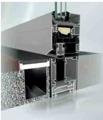
AWS 90.SI+ mit Nullniveau-Schwelle AWS 90.SI+ with zero-level threshold

Barrierefreie Fenstersysteme sorgen für generationsübergreifenden Komfort. Insbesondere die Nullniveau-Schwelle sorgt für ein ebenmäßiges Bild zwischen Innen und Außen. Diese Systemerweiterung erfüllt die ift-Richtlinie „Ermittlung und Klassifizierung der Überrollbarkeit von Schwellen (BA-01/1)“ und erreicht dabei die höchstmögliche Klassifizierung (Klasse 6). Dank unterschiedlicher Ausführungsmöglichkeiten der Schwelle, eignet sich das barrierefreie System sowohl für den Neubau (80 mm) als auch für Renovationsobjekte (50 mm). Die Absenkdichtung mit verzögerter hydraulischer Absenkung sorgt für einen kräftefreien Schließvorgang. Die integrierte Wasserrinne mit Rückschlagventil ermöglicht eine kontrollierte Entwässerung.